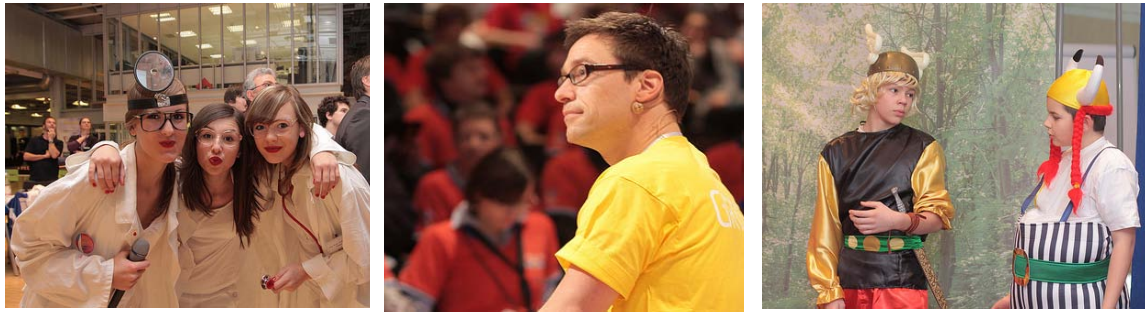
Eindrücke vom FLL Finale Zentraleuropa (22.1.2010, Heinz Nixdorf MuseumsForum Paderborn)